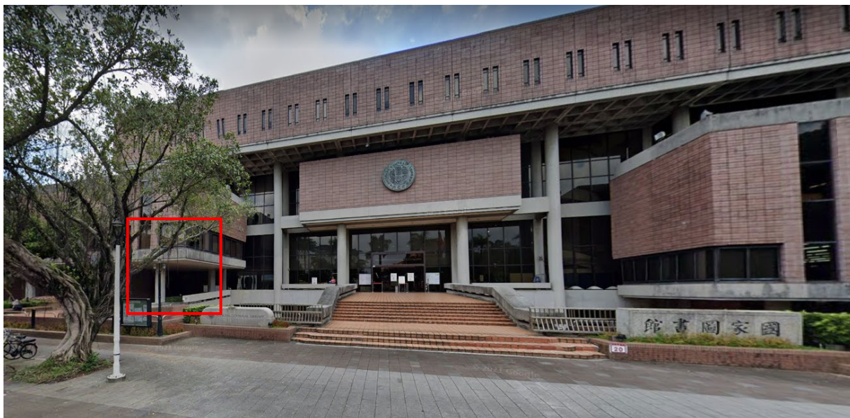
▲ 圖書館正門(紅框處為藝文中心入口)

活動地點：臺北國家圖書館-三樓國際會議廳(100 臺北市中正區中山南路 20 號)