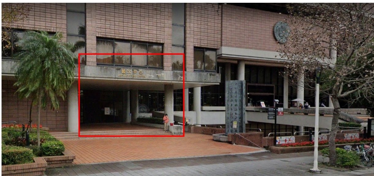
▲ 建議從面向圖書館正門左手邊的藝文中心入口進入