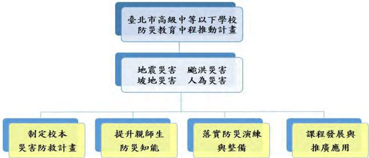
圖 7 臺北市政府教育局高級中等以下學校「防災教育中程實施計畫」114-116 年中程計畫架構