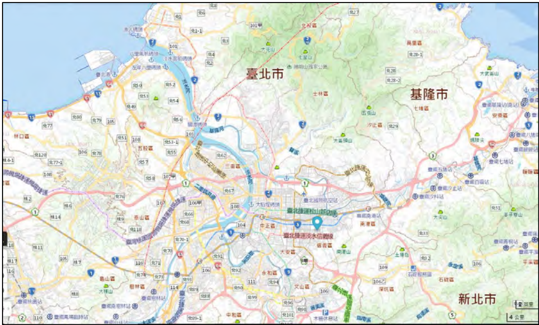
圖4 臺北市鄰近活動斷層分布圖