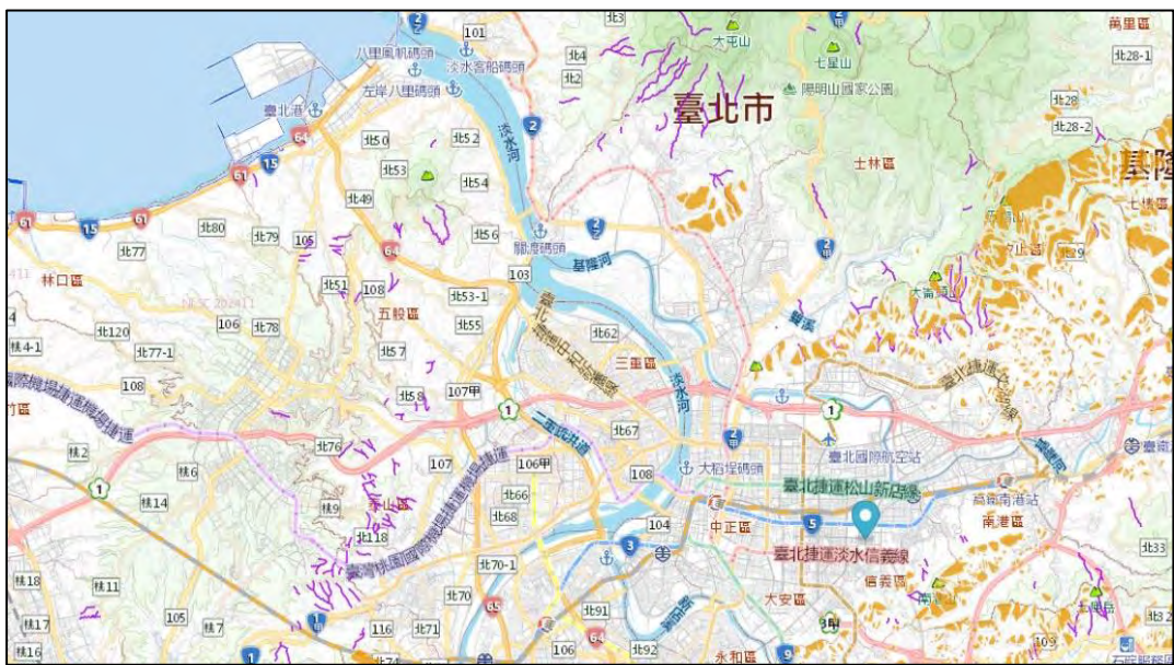
圖5 臺北市土石流及順向坡災害潛勢地圖

本市市中心區域位於臺北盆地底部，大屯火山群位於市區北邊與新北市接壤處，整個山系於市區內大致向南延伸並趨緩，直抵圓山、大直與內湖等地，是臺北市境內最大的山系；最高的七星山為 1,120 公尺，次高的大屯山為 1,092 公尺，山系中心地帶與北投側的外緣地帶有不少火山地形。市區東邊的內湖、南港與南邊的木柵多為丘陵地形；標高約 300 多公尺的南港山系則橫互於信義、南港兩區之間。坡地災害範圍廣泛，包含土石流、山崩、地滑及順向坡所引起之災害等，其主要受山地坡度、水、地震及人為影響，本市為盆地地形，四周為山地，常遭遇颱風、暴雨等侵襲，易造成土石流之發生(如圖 5)。