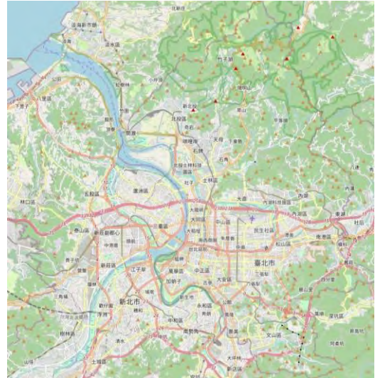
圖 3 臺北市地形圖

本市常見災害類型主要分為地震災害、坡地災害、颱洪災害與人為災害四類。依據教育部公告全國各級學校災害潛勢結果及本局災害潛勢評估，本局所屬學校災害潛勢分析結果如下表：