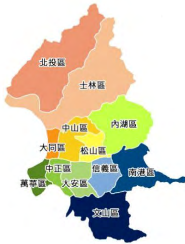
圖 2 臺北市行政區圖

本市四周均與新北市交界，土地面積約 271.7997 平方公里，轄區劃分為十二個行政區，分為松山區、大同區、內湖區、士林區、信義區、萬華區、大安區、中山區、南港區、北投區、中正區及文山區，設籍臺北市人口約 250 萬人（如圖 2、圖 3）。