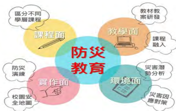
圖 1 防災教育計畫目標