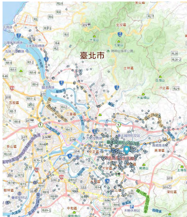
圖6 臺北市近五年淹水點

颱風主要生成季節是在 7 至 10 月，平均約有 18.3 個，佔全年颱風生成總數的 69%，若颱風停留時間過久及特殊嚴重水患，以民國 90 年 9 月中旬納莉颱風為例，於本市降下豪大雨量，遠超過臺北市下水道系統之設計容量，除造成臺北市捷運及臺鐵臺北車站淹水外，亦使內湖、南港、信義、松山等行政區幾乎全區淹水(如圖 6)。