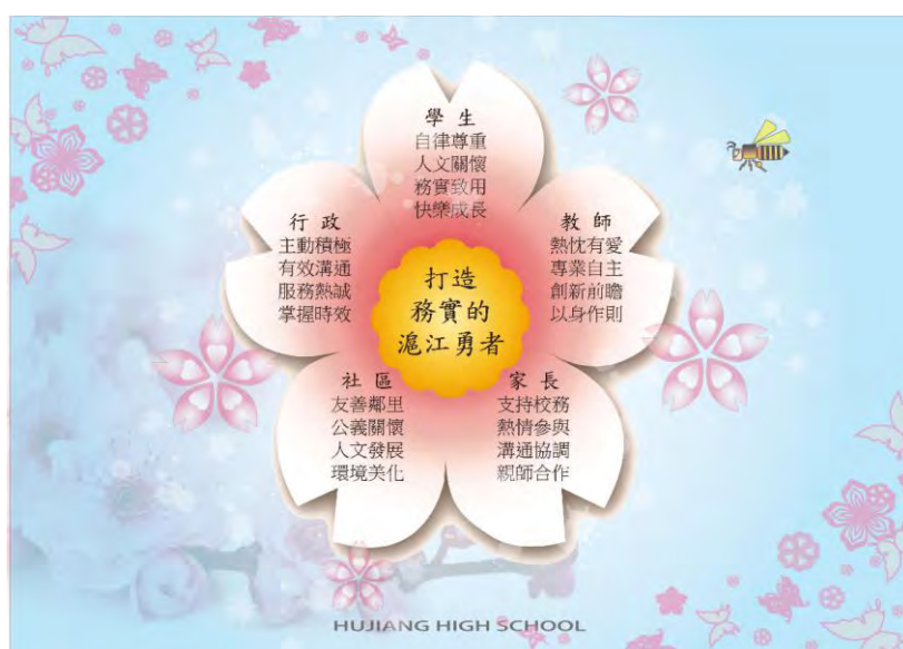
滬江高中學校圖像