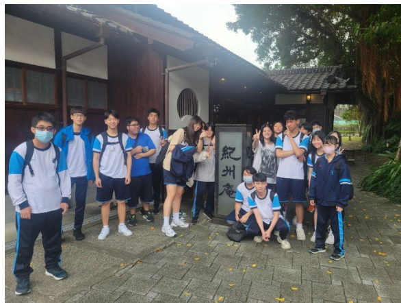
參訪紀州庵文學森林