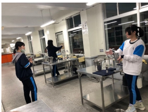
社團相關圖片 110-1 社團課側拍