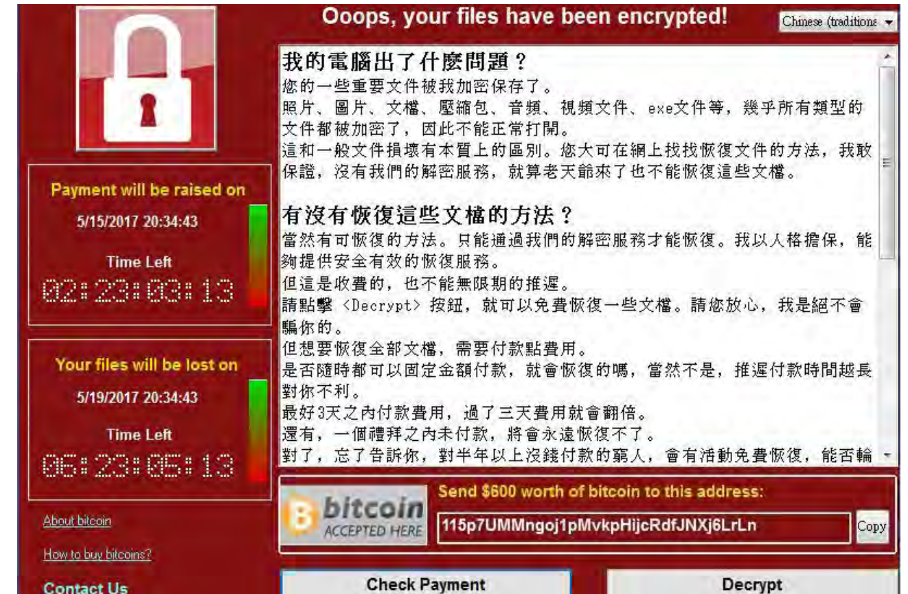
圖 3-1 勒索病毒 Wana Decrypt0r 的中毒時顯示的勒索訊息

所謂「知己知彼，百戰百勝」，在開始建立好防線保護自己的資料和資訊之前，先來看看目前常見的攻擊方式，用以協助我們針對可能的弱點進行補強。