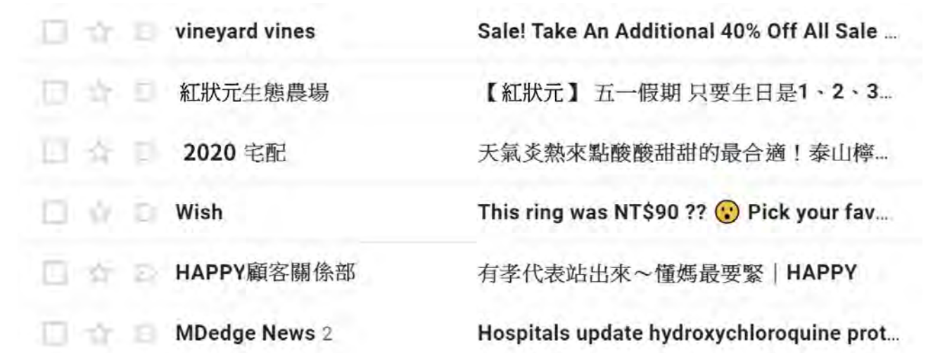
圖 3-2 垃圾郵件大多為廣告或是隱含資安疑慮的詐騙信件